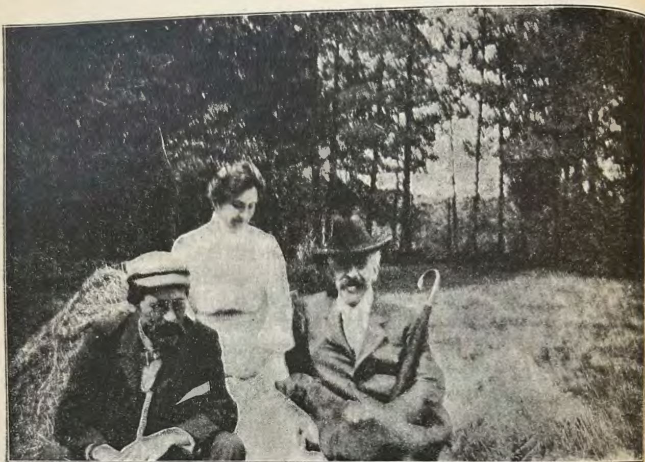
А. П., его жена О. Л. и К. С. Станиславскій. (1903 г.).