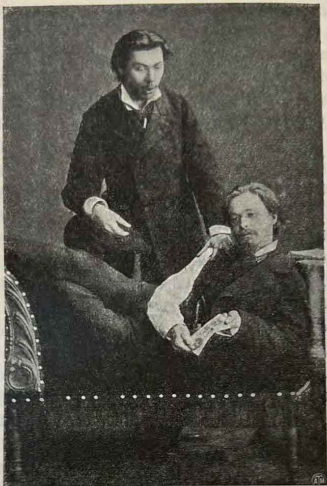
Первый крупный гонораръ (25 р.) А. П. Чехова.

превосходный юристъ. Адвокатура была для него одной изъ завидныхъ профессій и онъ долго не прощалъ мнѣ того, что по окончаніи юридическаго факультета я не пошелъ сразу въ адвокаты. «Будь адвокатомъ», часто онъ мнѣ писалъ и говорилъ. Его «Островъ Сахалинъ», которому онъ придавалъ значеніе диссертациі, — произведеніе скорѣе юриста, чѣмъ врача.