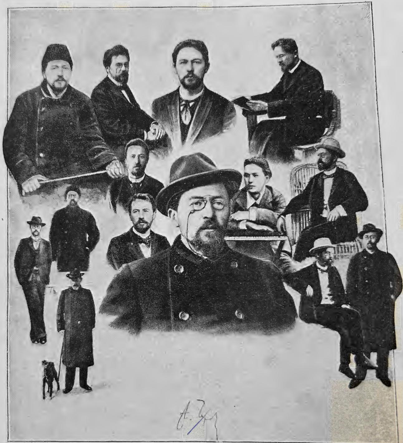
А. П. Чеховъ въ разные годы своей жизни.