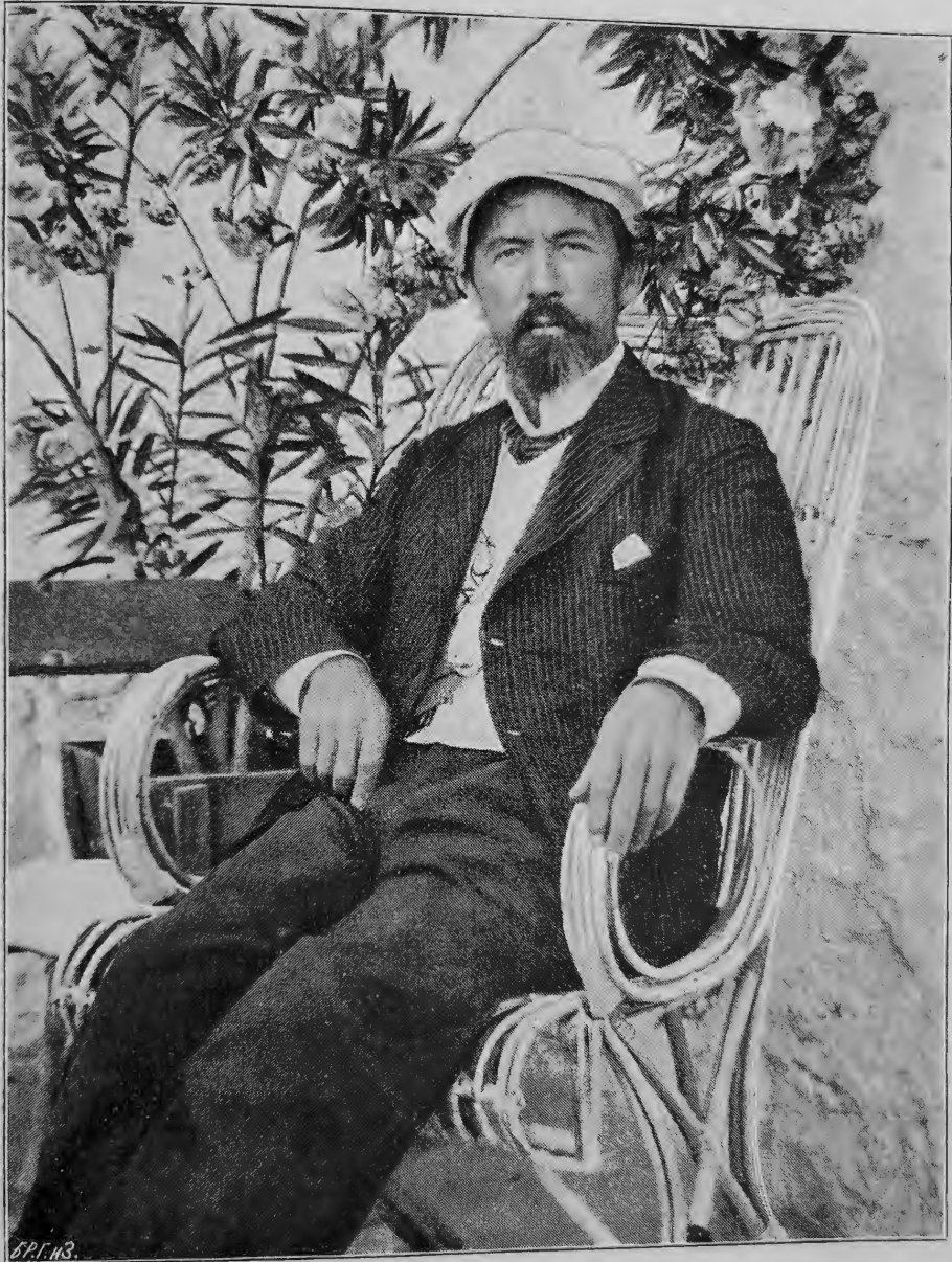
Ялта, 1903 г.